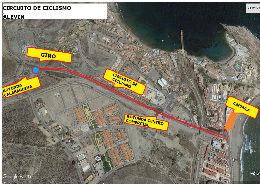
CIRCUITO DE CICLISMO ALEVIN