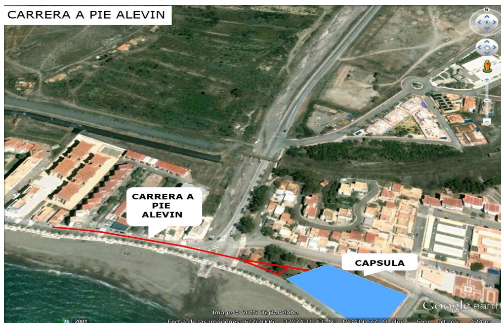
CARRERA A PIE ALEVIN